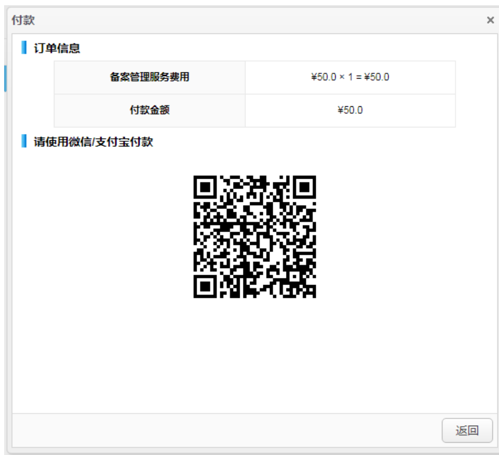
图 4-7 缴费（扫码支付界面）