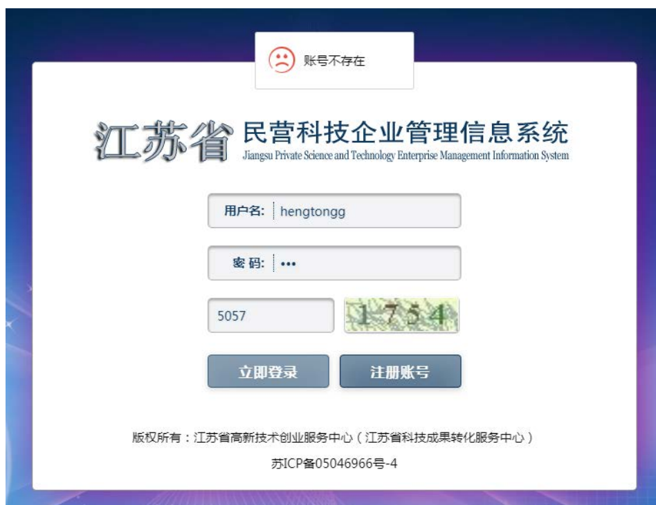
图 3-4 登录失败（账号不存在）