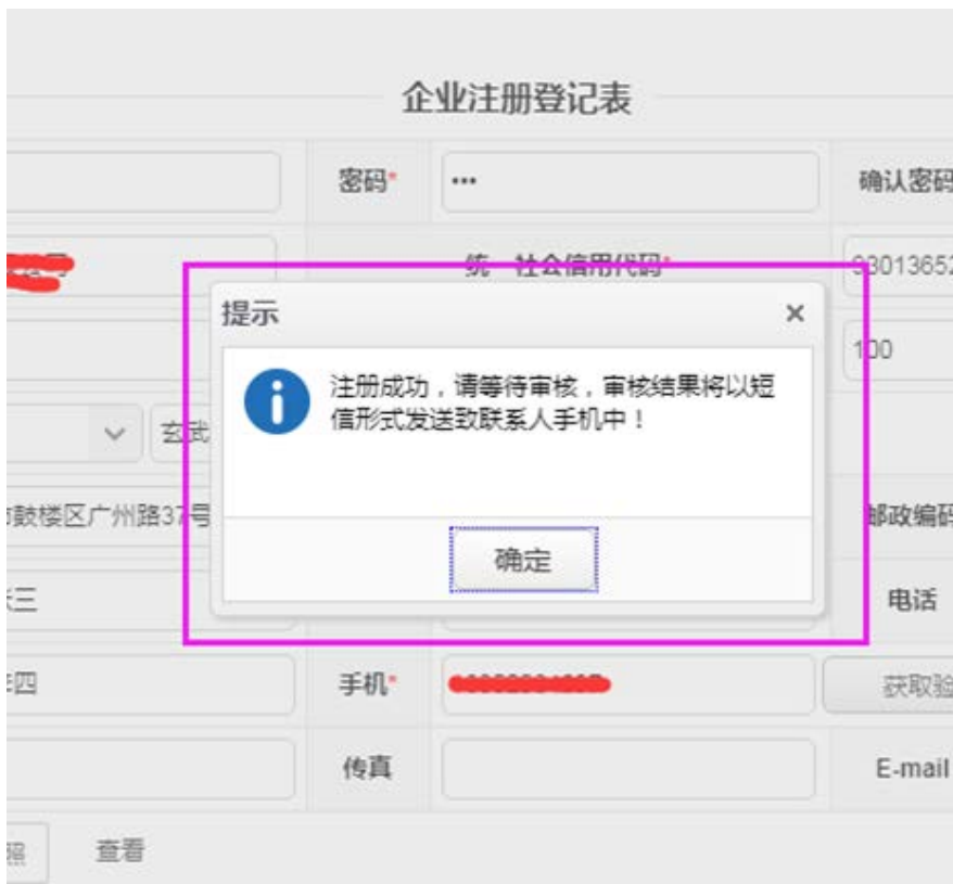
图 3-9 注册成功提示界面

若点击“提交”按钮，出现如图 3-9 所示情况，说明企业账号注册成功，需要等待县（市、区）科技部门对企业注册登记表进行审核，并收到审核通过短信通知后，方可登陆系统。