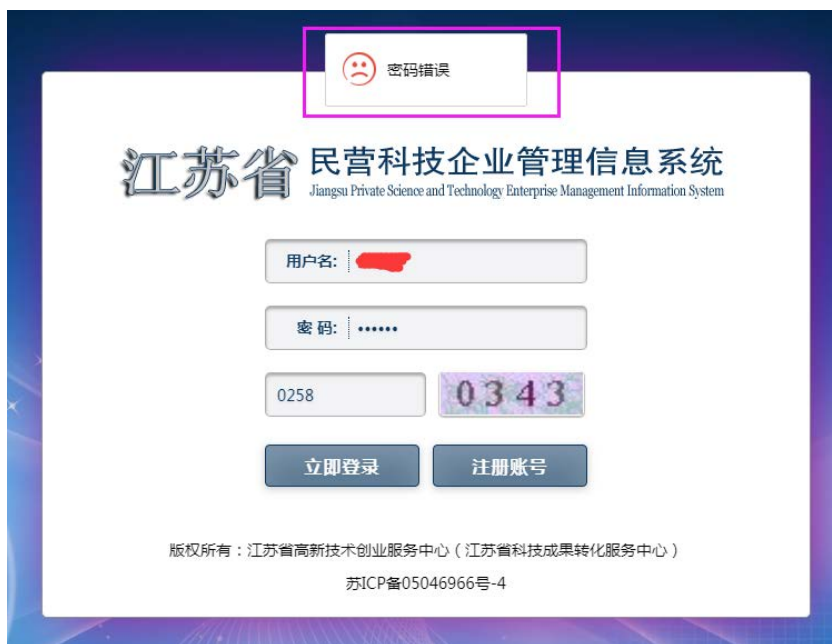
图 3-2 登录失败（密码错误）

点击“立即登录”按钮后，会出现如图 3-2、图 3-3、图 3-4 所示的情况，这种情况均表示登录失败。出现图 3-2 中“密码错误”提示，说明输入的密码有误；出现图 3-3 中“账号未启用”提示，说明注册的账号，县（市、区）科技部门还未进行审核，账号处于未审核状态，需等待县（市、区）科技部门审核过后，收到图 3-5 所示的账号审核通过短信通知后，才可登录系统；出现图 3-4 中“账号不存在”，若已经在系统里注册过，并收到了账号审核通过短信通知，说明账号注册的时候，登录名前后带入了空格键，可以联系当地的县（市、区）科技部门帮忙修改一下登录名，去掉登录名前后带入了的空格键。若未在系统中注册过账号，可以点击“注册账号”按钮进入注册界面进行账号注册。