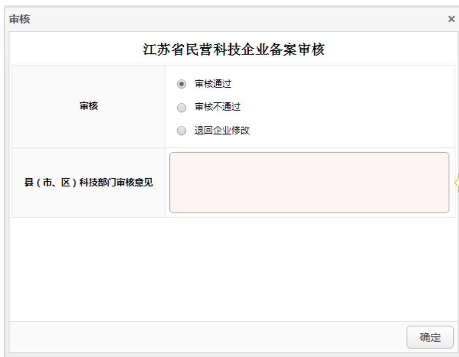
图 4-13 县（市、区）科技部门审核界面

在“已审核”界面（图 4-14）中，显示的是县（市、区）科技部门所有审核过后的申请表列表，管理员可以根据需求，选择申请状态查询审核过的申请表，并勾选相应的申请表复选框，即可导出推荐汇总表。