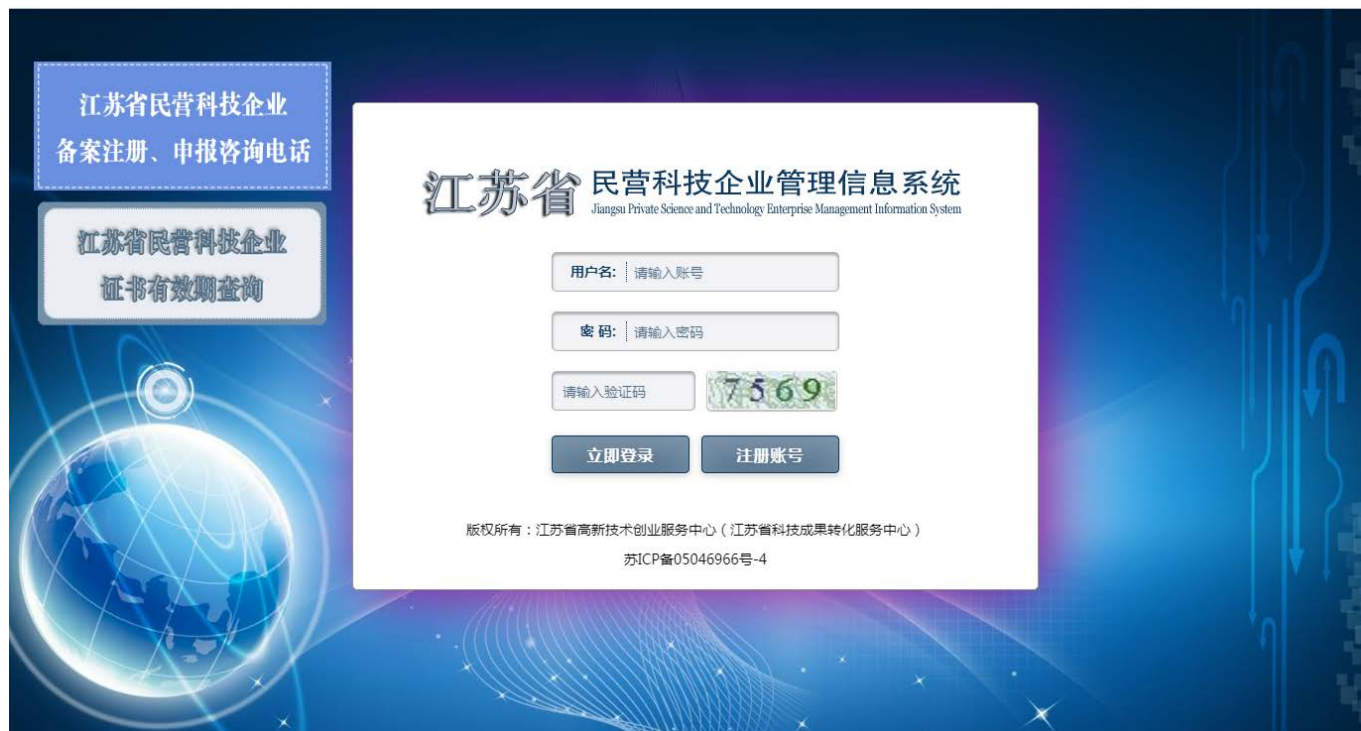
图 3-1 登录界面

在网站的登录页面，如图 3-1 所示，用户输入用户名、密码及验证码，点击“立即登录”按钮，即可实现登录功能。