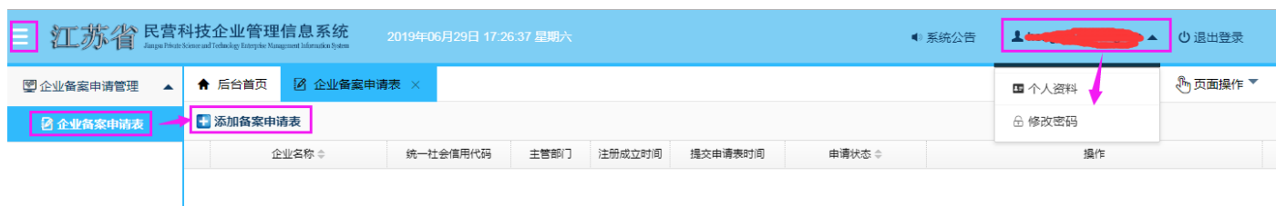
图 4-1 企业用户登录系统后主界面

图 4-1 所示为企业用户登录系统后进入的主界面。当点击系统左上方“☰”图标时，便可实现左边菜单栏收起/展开操作。当鼠标经过系统右上方企业登录名的时候，即可展现用户基本信息操作菜单栏，用户可以进行企业登记注册时部分信息修改和密码修改操作。点击左边菜单栏中“企业备案申请表”即可进入企业备案申请界面