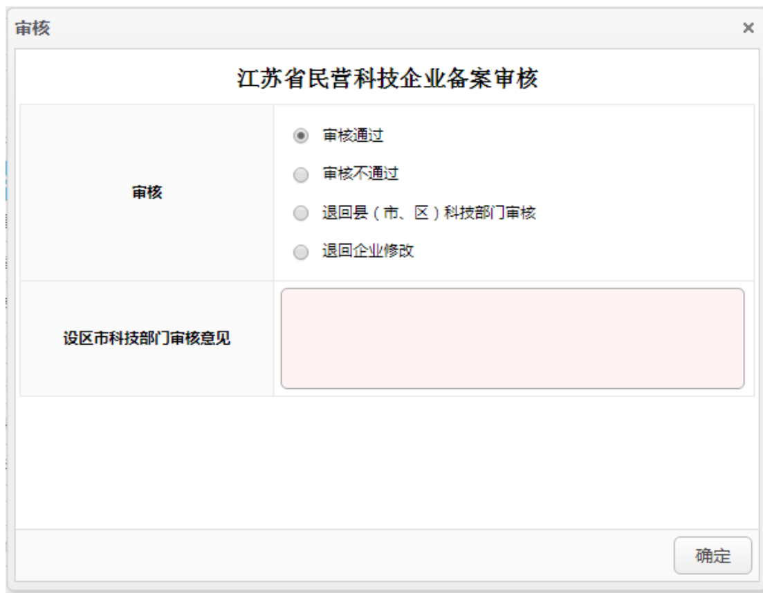
图 4-15 设区市科技部门审核界面

核”。其中“企业备案申请表”功能及操作说明和县（市、区）科技部门相同。“待审核”显示的是该设区市科技部门下，所有县（市、区）科技部门审核通过的以及省民营协会退回该设区市审核的所有申请表列表。设区市科技部门可以进行审核操作，当点击“审核”按钮，将跳出审核界面（图 4-15 所示）。