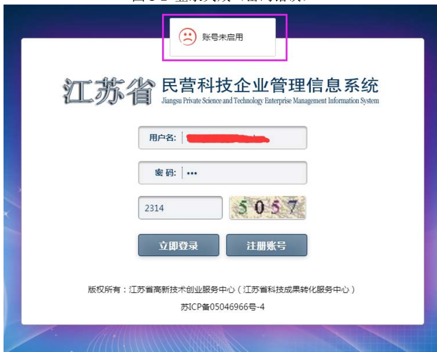
图 3-3 登录失败（账号未启用）